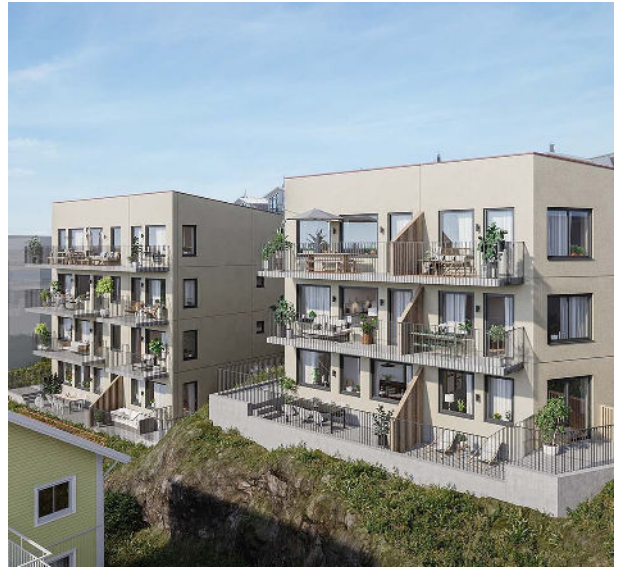
Försäljningen av återstående tomter i Lysekil har återupptagits.

Målsättningen är att sälja de två kvarvarande tomterna under första halvåret 2026.