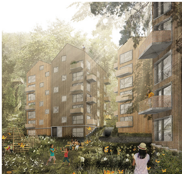
Projektet Smedby i Norrköping

Byggrätten Terrassen i Norrköping har, efter överenskommelse, återlämnats till Norrköpings kommun. Grundingen valde att inte tillträda byggrätten mot bakgrund av de krav på upplåtelseform som var förenade med projektet. Grundingen väljer istället att prioritera andra projekt som bedöms äga större potential.