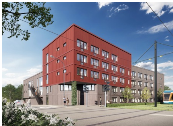
Uthyrning pågår i projektet Altanen, Norrköping.

Grundingen har beslutat att genomföra en nyemission med företrädesrätt för befintliga aktieägare med stöd av bemyndigande från bolagsstämman den 3 maj 2023. Emissionen omfattar högst 132 148 892 aktier och volymen är ca 26,4 MSEK. Emissionen är garanterad och likviden ska främst användas till att återbetala kortfristiga lån som upptogs i samband med återbetalningen av obligationen.