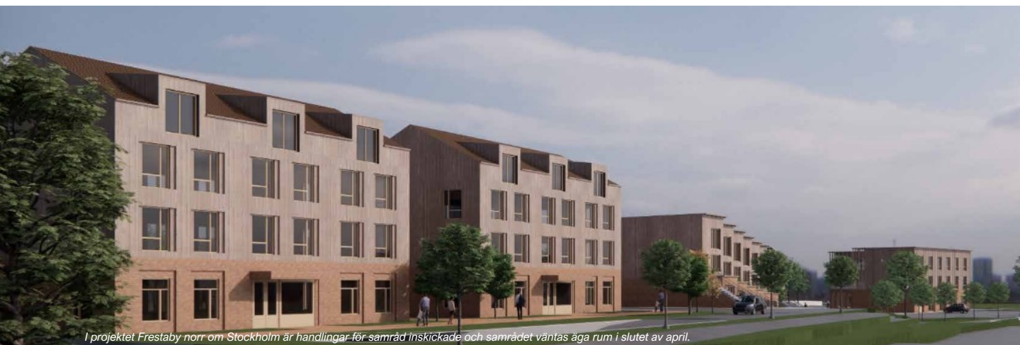
I projektet Frestaby norr om Stockholm är handlingar för samråd Inskickade och samrådet väntas äga rum i slutet av april.