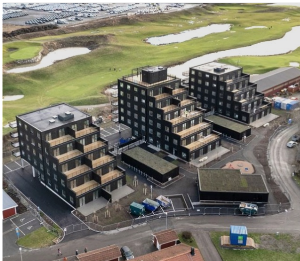
Projektet Torslanda Terrasser färdigställdes under kvartalet.

Slutsamrådet med kommunen avlöpte väl och entreprenaden blev godkänd. Godkänt slutbesked är mottaget. Marknadsföring och inflyttning avseende de 46 hyresrätterna pågår. Projektet Bastuban kommer att behållas under Grundingens egen förvaltning.