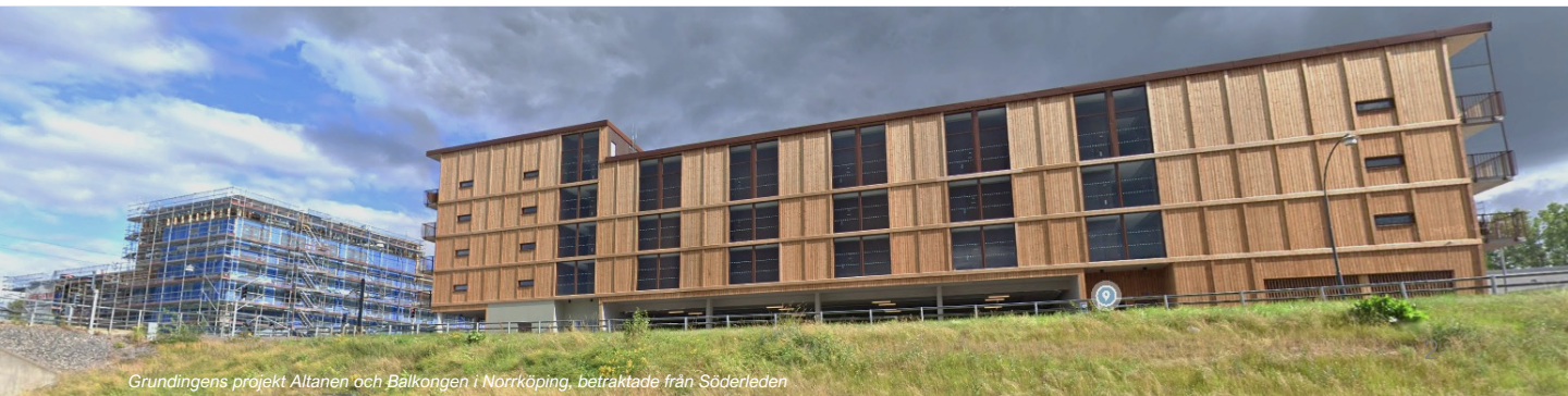
Grundingens projekt Altanen och Bålkongen i Norrköping, betraktade från Söderleden

Krook & Tjäder arbetar med att uppdatera planskisser för Tureholm och undersöka byggbara ytor. Större villor skulle potentiellt kunna ändras till parhus. Förslagen kommer därefter att redogöras för kommunen. Projektet i Trosa skulle väl kunna lämpa sig för fristående villor, kedjehus eller radhus. Tomten är stor och beräknas för nuvarande rymma mellan 70-110 bostäder. Projektet kommer delas upp i etapper. Trosa kommun har en relativt hög procentuell befolkningstillväxt.