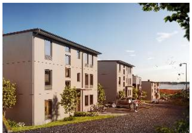
I Brf Skeppsholmen får du närhet till vackra strandpromenader, slående kvällssol, attraktiva restauranger och promenadavstånd till Lysekils centrum.