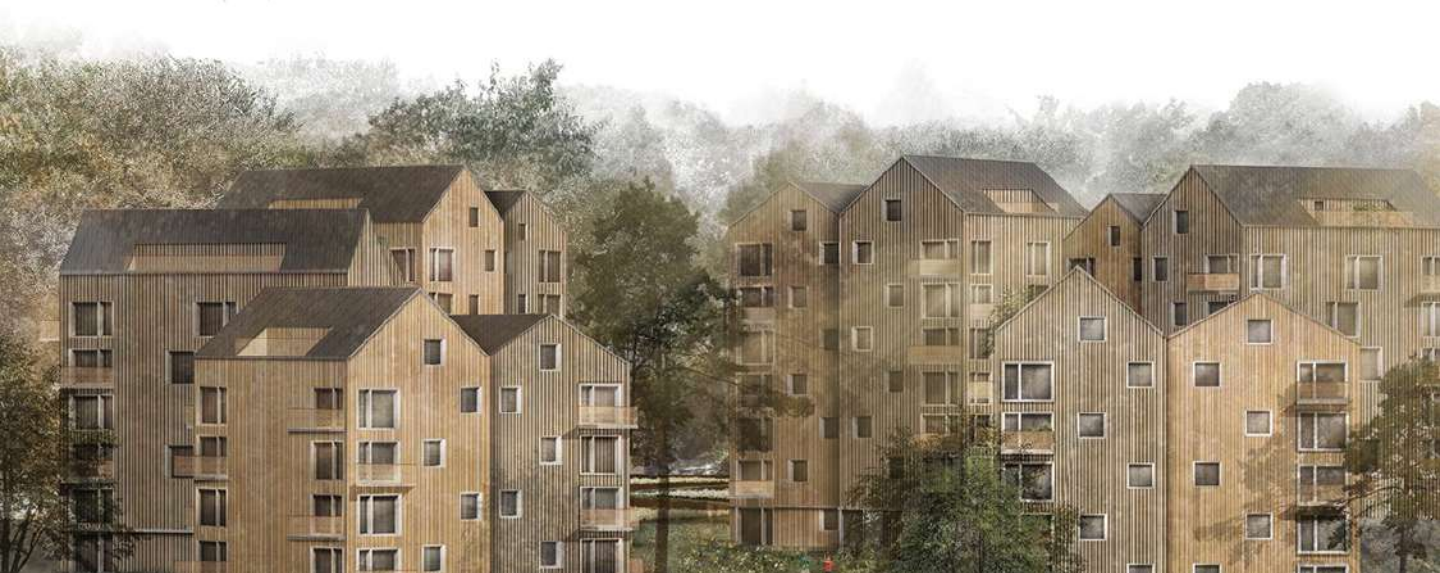
Under kvartalet signerades marköverlåtelseavtal för projektet Smedby i Norrköping. Byggnation beräknas starta under våren 2023.